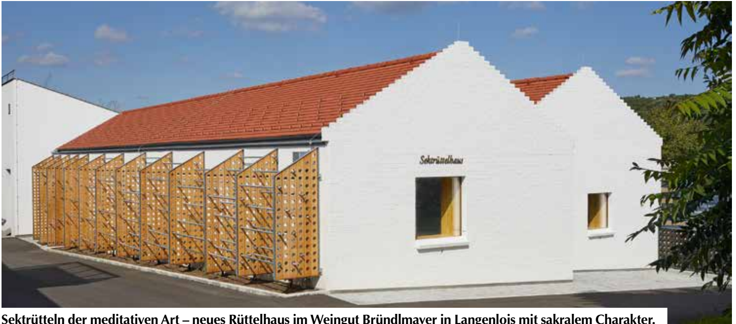
Sektrütteln der meditativen Art – neues Rüttelhaus im Weingut Bründlmayer in Langenlois mit sakralem Charakter.

Weingut Bründlmayer Familie Bründlmayer Zwettlerstraße 23 A-3550 Langenlois tel: +43 2734 2172-0 mail: weingut@bruendlmayer.at